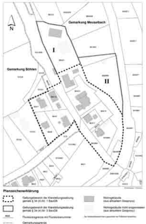
Planzeichnung Maßstab 1 : 1.000 (Teil B)